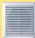
Cozinha, Divisória e Painel