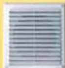
Cozinha, Divisória e Painel