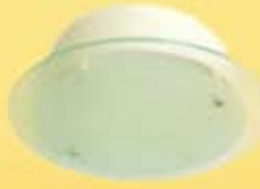
Com Luminária (BL)

A falta de uma exaustão ou ventilação adequada num ambiente é a fonte de problemas de odores, mofo e umidade.