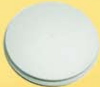
Redondo Liso (BR)