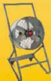
Ventex Ventilador Axial c/ suporte móvel