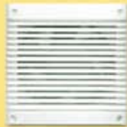
Quadrado (B, D e P)